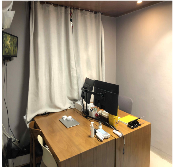
행정실 (겸 보통교과 강사실)