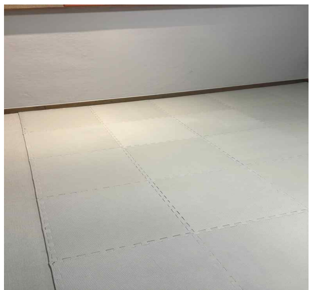
상담2실 (겸 학생휴게실)